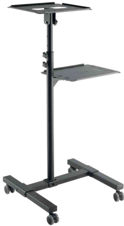
Multimedia Projektionswagen aus Stahl, 2-stufig höhenverstellbar

- für den Einsatz in Konferenzzentren, Hotels, Sitzungssäle, Besprechungsräume, Schulungsräume und Showrooms geeignet