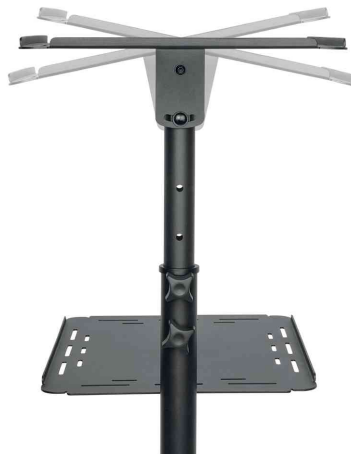
Multimedia Projektionswagen aus Stahl, Arbeitsflächen neigbar