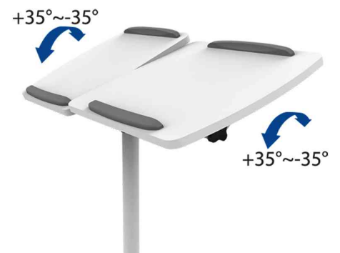
Multimedia Projektionswagen, Arbeitsflächen 35 Grad neigbar