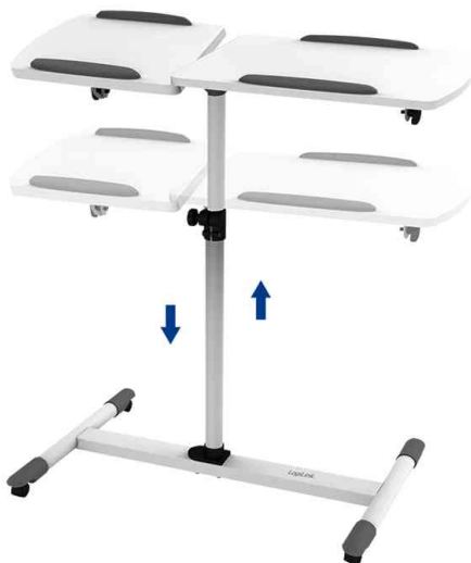
Multimedia Projektionswagen, höhenverstellbar