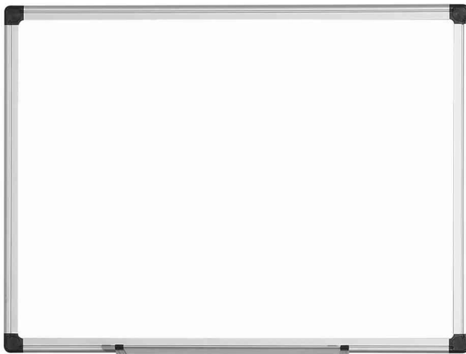
Weißwandtafel "Maya" - emailliert