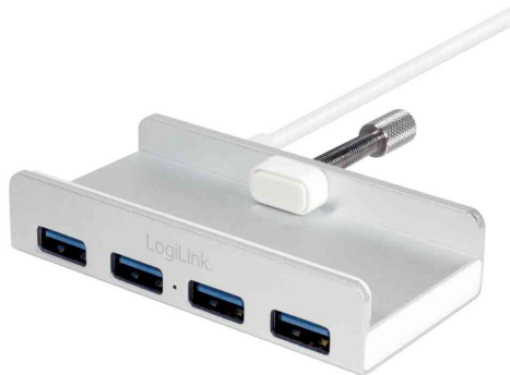
USB 3.0 Hub, 4 Port