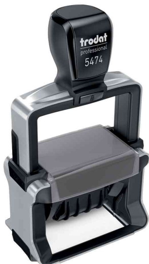
Datumstempel Professional 4.0 5474

Info: Alle konfigurierbaren Stempel liefern wir bereits ab einer Bestellung von 1 Stück Frei Haus! Bitte beachten Sie, dass konfigurierbare Stempel immer in einem separaten Auftrag ausgeführt werden!