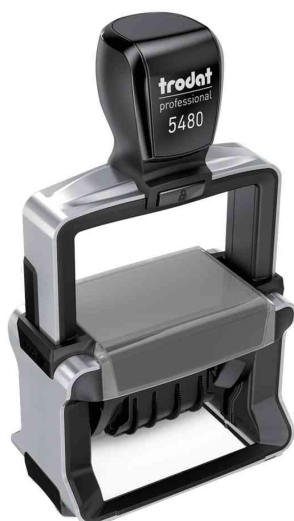
Datumstempel Professional 4.0 5480

Zubehör: Ersatzstempelkissen: Abgabe nur in ganzen VE's