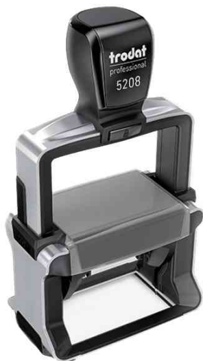
Textstempel Professional 4.0 5208

Zubehör: Ersatzstempelkissen: Abgabe nur in ganzen VE's