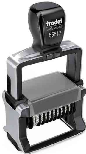
Ziffernstempel Professional 4.0 55512

Zubehör: Ersatzstempelkissen: auf Blisterkarte, Abgabe nur in ganzen VE's