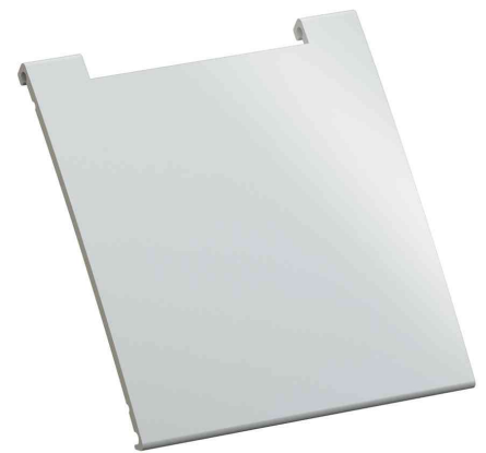
KAPSA XXS Abdeckung, weiß