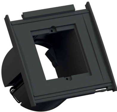
Steckdoseneinheit KAPSA XXS, 1x Leerfeld