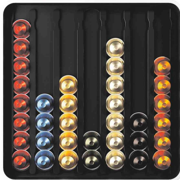
Kapselhalter multibox "Capsule Holder"