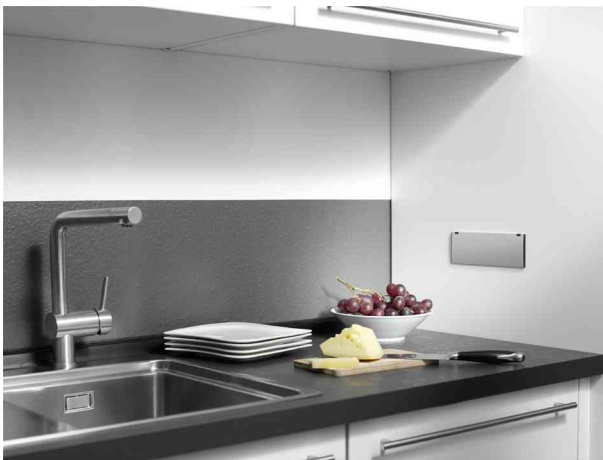
Steckdoseneinheit KAPSA S mit Zubehör, geschlossen