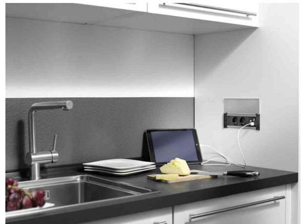
zeigt das Produkt in der Anwendung