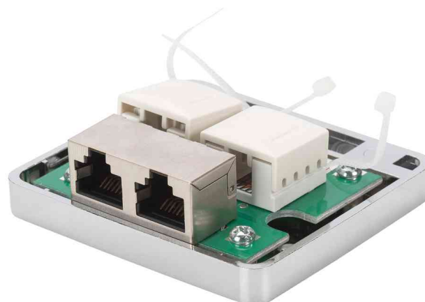
Aufputzdose Kat.6, 2x RJ45