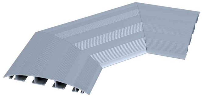
Kabelkanal CABLE BRIDGE, 45 Grad Winkel