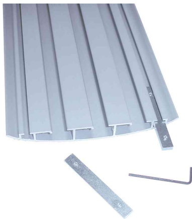
Kabelkanal CABLE BRIDGE, Verbindungselement