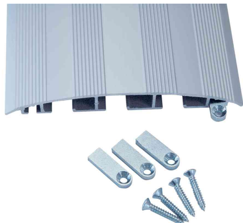
Befestigungszubehör für CABLE BRIDGE