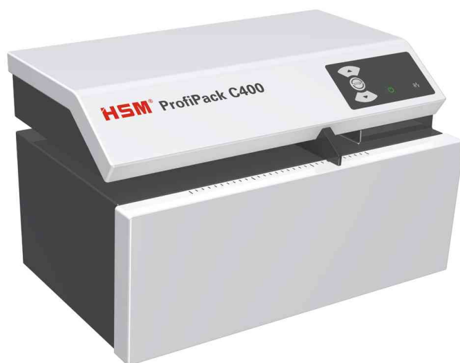
Verpackungspolstermaschine ProfiPack C400