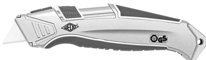
CERA-Safeline Safety-Cutter ALU