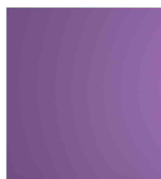
Trennwand easyScreen, lila