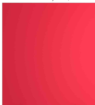
Trennwand easyScreen, rot