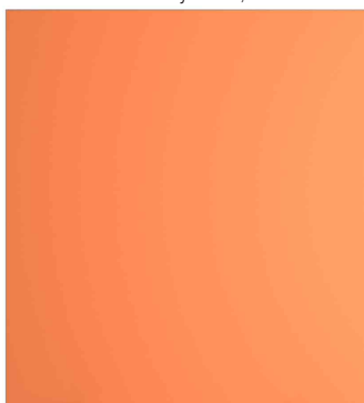
Trennwand easyScreen, orange