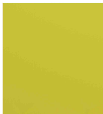
Trennwand easyScreen, grün