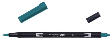
mit 2 Spitzen