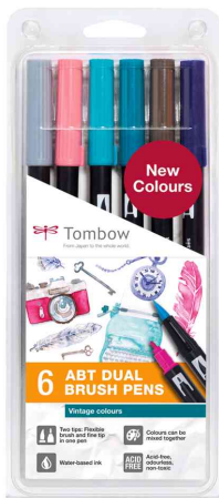
Doppelfasermaler "ABT DUAL BRUSH PEN", 6er-Set Vintage Colours