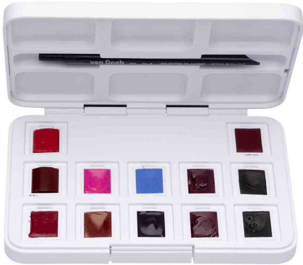
Aquarellfarbe Van Gogh Rosa- &amp; Violett-Töne, 12er-Set