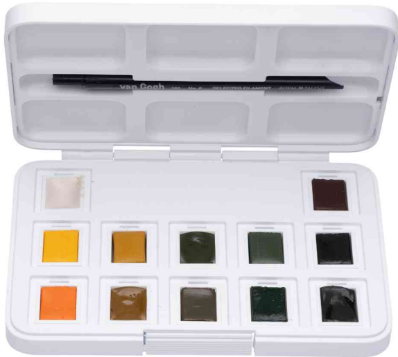
Aquarellfarbe Van Gogh Naturfarben, 12er-Set