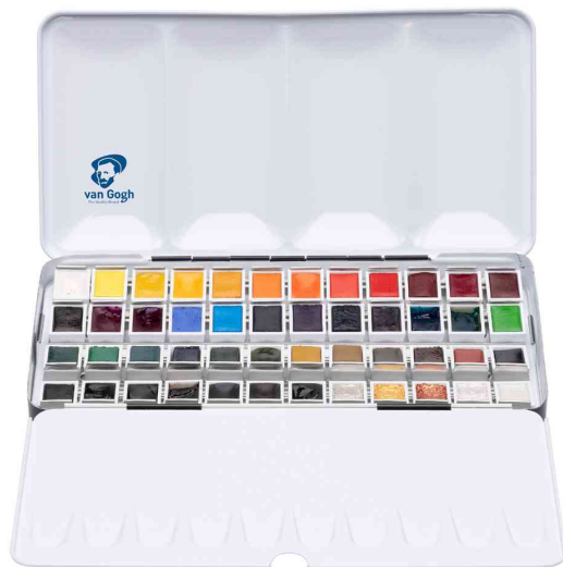
Aquarellfarbe Van Gogh, 48er-Set