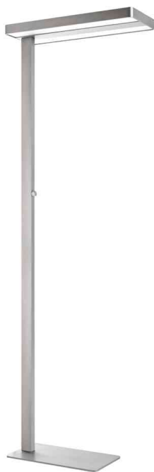
LED Energiespar-Stehleuchte LIXUS