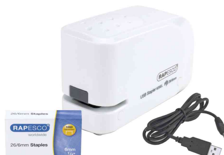
Elektrisches Heftgerät 626EL, weiß