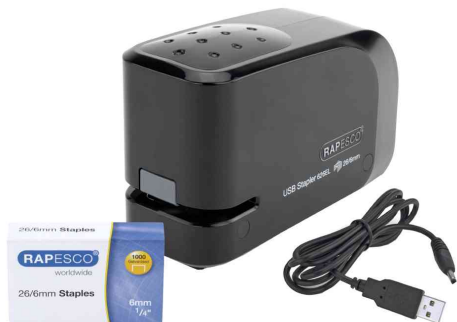
Elektrisches Heftgerät 626EL, schwarz