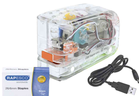
Elektrisches Heftgerät 626EL, transparent