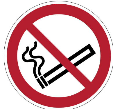
Verbotsskennzeichen "Rauchen verboten"