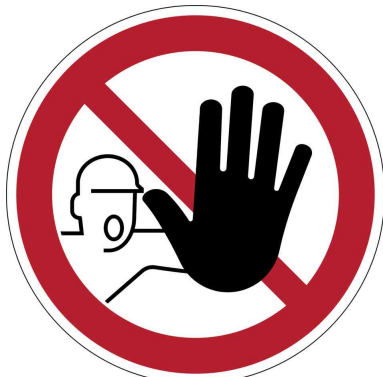
Verbotsskennzeichen "Zutritt verboten"