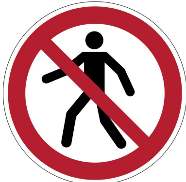
Verbotsskennzeichen "Fußgängerweg verboten"

- zur Kennzeichnung von Gefahrenbereichen