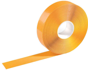
Bodenmarkierungsband "DURALINE STRONG" - gelb

- zur Kennzeichnung von Geh- und Fahrradwegen