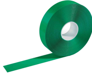
Bodenmarkierungsband "DURALINE STRONG" - grün