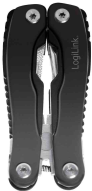
Multitool, 11 Werkzeuge in 1 - geschlossen