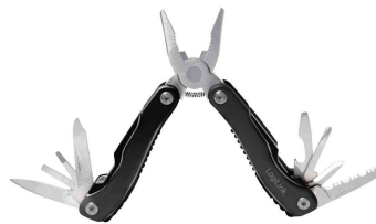
Multitool, 11 Werkzeuge in 1 - offen