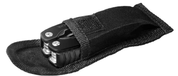
Multitool, 11 Werkzeuge in 1 - in Aufbewahrungstasche