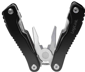
Multitool, 11 Werkzeuge in 1