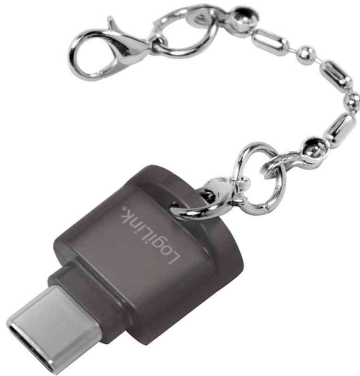
USB 2.0 Card Reader als Schlüsselanhänger