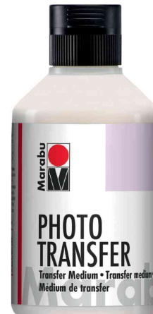
Foto-Transfer Medium PHOTO TRANSFER, 250 ml