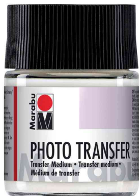
Foto-Transfer Medium PHOTO TRANSFER, 50 ml