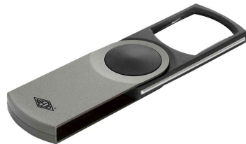
Rechtecklupe SWING-IT mit LED-Beleuchtung, silber