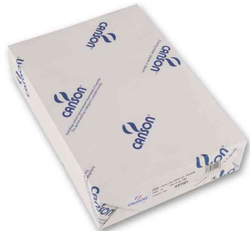
Zeichenkarton Bristol, VE