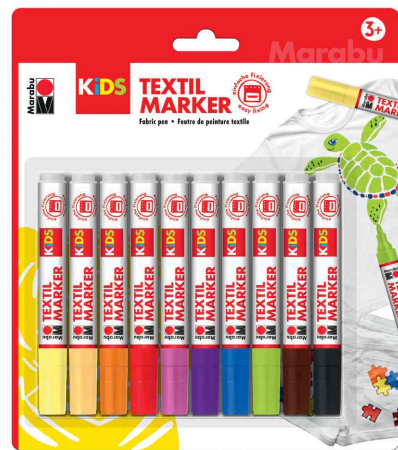
Textilmarker, 10er Blister