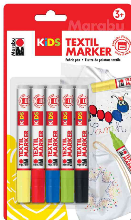
Textilmarker, 5er Blister