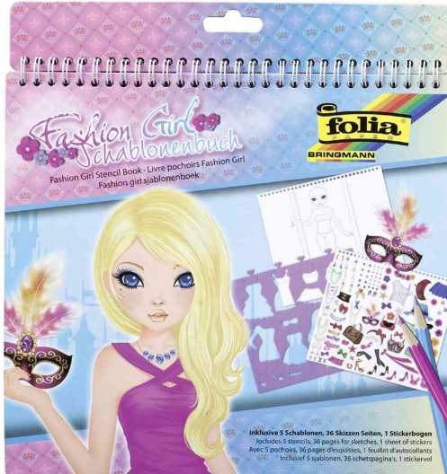
Schablonenbuch "Fashion Girl"

ACHTUNG! Nicht geeignet für Kinder unter 36 Monaten, wegen verschluckbarer Kleinteile.