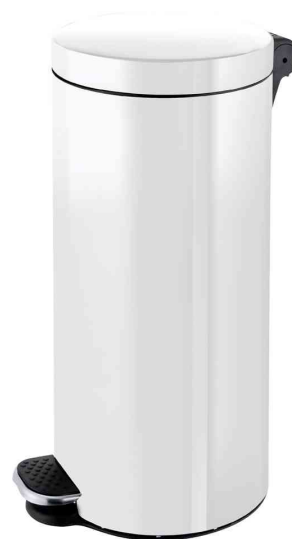
Silberionen-Tret-Abfalleimer "the knight", weiß