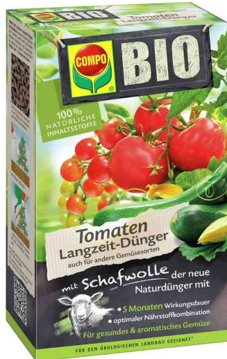
COMPO BIO Tomaten Langzeit-Dünger mit Schafwolle

- für alle Tomatenpflanzen und -sträucher sowie Frucht und Knollen bildendes Feingemüse und Kräuter