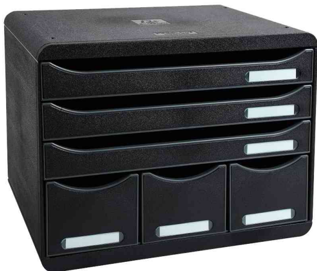
Schubladenbox STORE-BOX quer, 6 Schübe, schwarz

- für die Ablage von Dokumenten aller Art