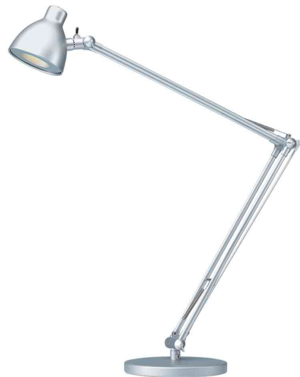
LED-Tischleuchte Valencia, silber