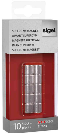
Neodym-Design-Magnete Zylinder "Strong" C5, 10er Set