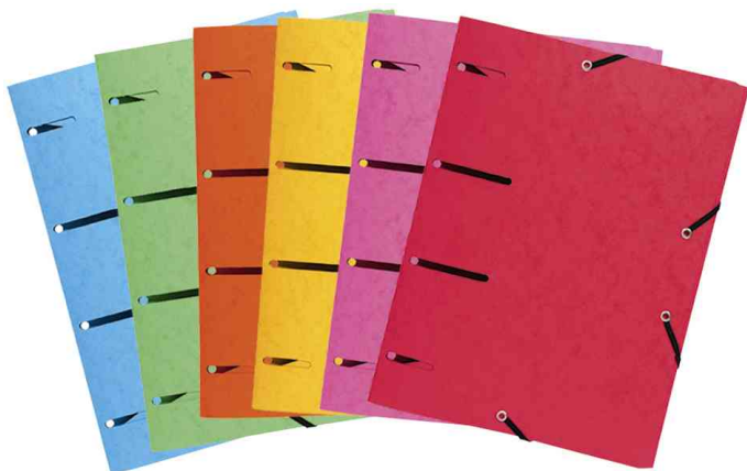
Sammelmappe "Punchy +", 4-fach Lochung