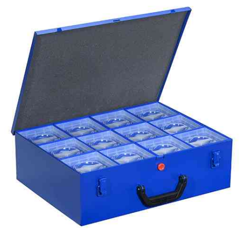
EuroPlus Pro M 44XH-12L