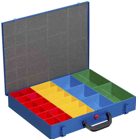
EuroPlus Pro M 44H-23