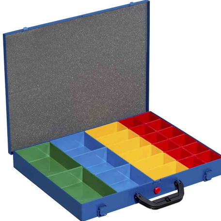
EuroPlus Pro M 44L-23