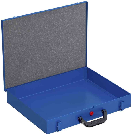
EuroPlus Pro M 44H-1

- zum Sortieren von Werkzeugen, Schrauben, Kleinteilen