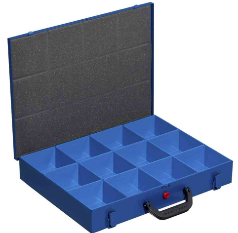
EuroPlus Pro M 44H-12