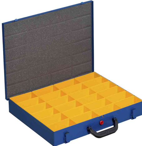
EuroPlus Pro M 44H-24