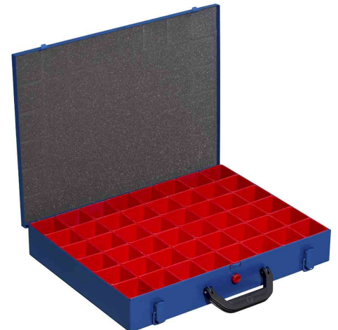
EuroPlus Pro M 44H-48