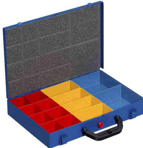
EuroPlus Pro M 34L-14