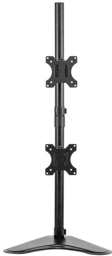
Doppel-Monitorarm Seasa mit Standfuß, vertikal