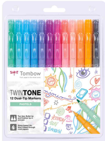
Doppelfasermaler "TwinTone" Pastell Colours, 12er Set