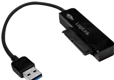
USB 3.0 - 2,5" SATA Adapterkabel

- zum Anschluss von SATA Festplatten, CD-Laufwerken etc. an USB 3.0 Port