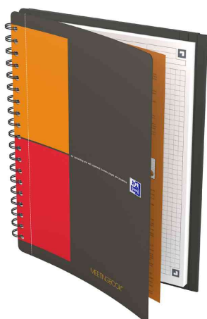
Collegeblock "Meetingbook", kariert