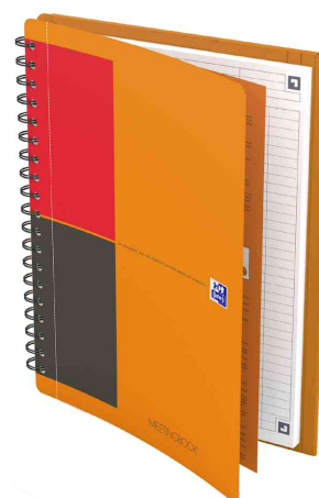
Collegeblock "Meetingbook", liniert