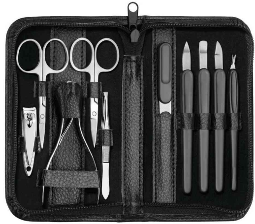
Manikür-Set, schwarz, Innenansicht