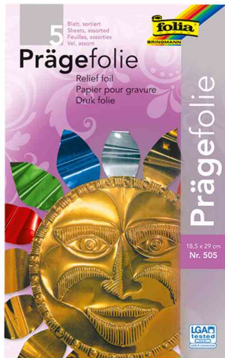
Prägefolienmappe, farbig sortiert

- die fertigen Metallapplikationen können unter anderem zum Verzieren von Karten, beim Scrapbooking, zum Dekorieren von Gegenständen oder für individuelle Tischdekorationen verwendet werden