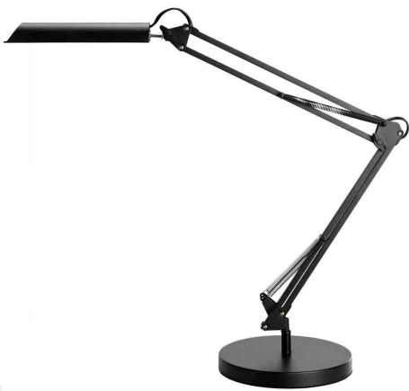
LED-Tischleuchte SWINGO, schwarz, Sockel