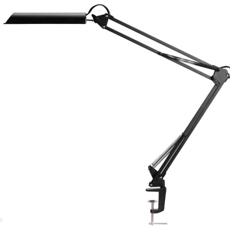
LED-Tischleuchte SWINGO, schwarz, Tischklemme