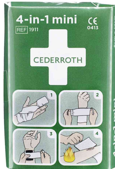
4-in-1 Blutstiller-Verband, mini