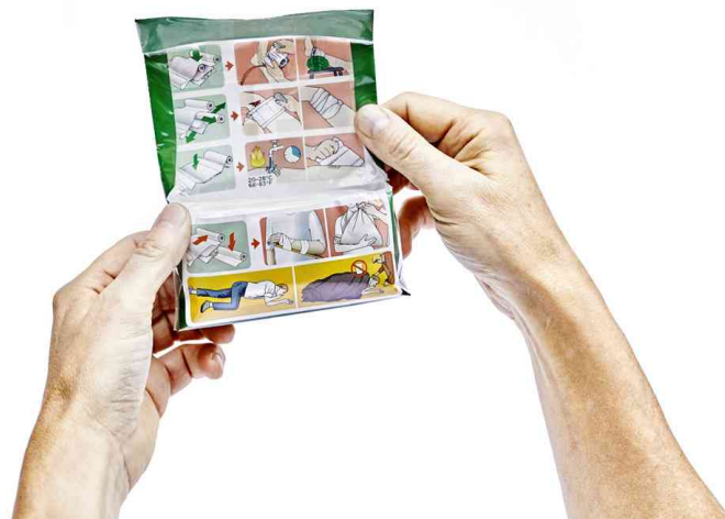
4-in-1 Blutstiller-Verband, universal