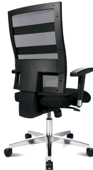
Bürodrehstuhl "X-Pander", Rückansicht