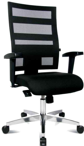
Bürodrehstuhl "X-Pander", Frontansicht