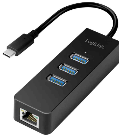
USB 3.0 auf Gigabit Adapter, 3-Port USB Hub