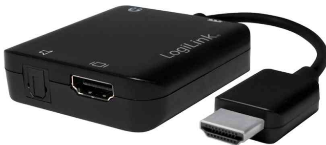
4K x 2K HDMI Audio Extraktor Konverter