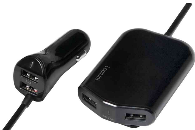
USB KFZ-Ladegerät für Vorder- & Rücksitze